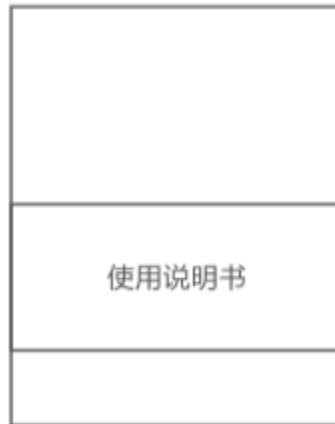
Manual de instrucțiuni